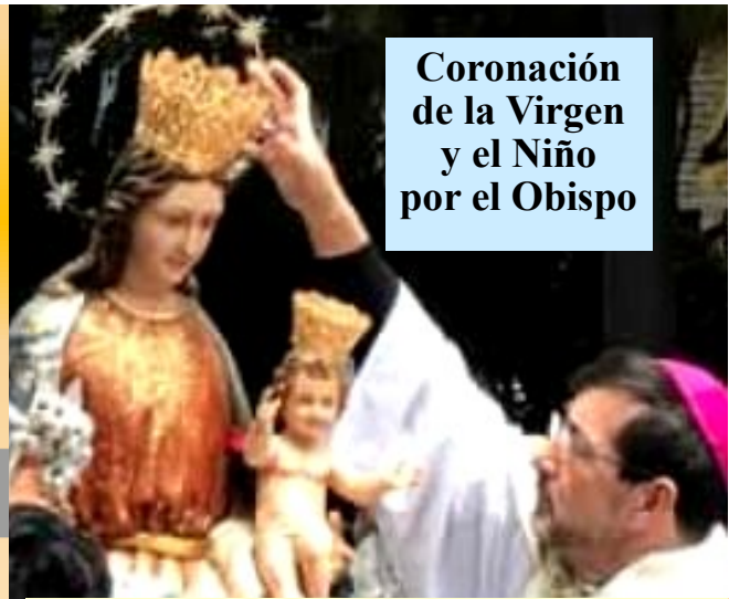
Coronación de la Virgen y el Niño por el Obispo

PARROQUIA NTRA. SRA. DE EUROPA Abril 2019